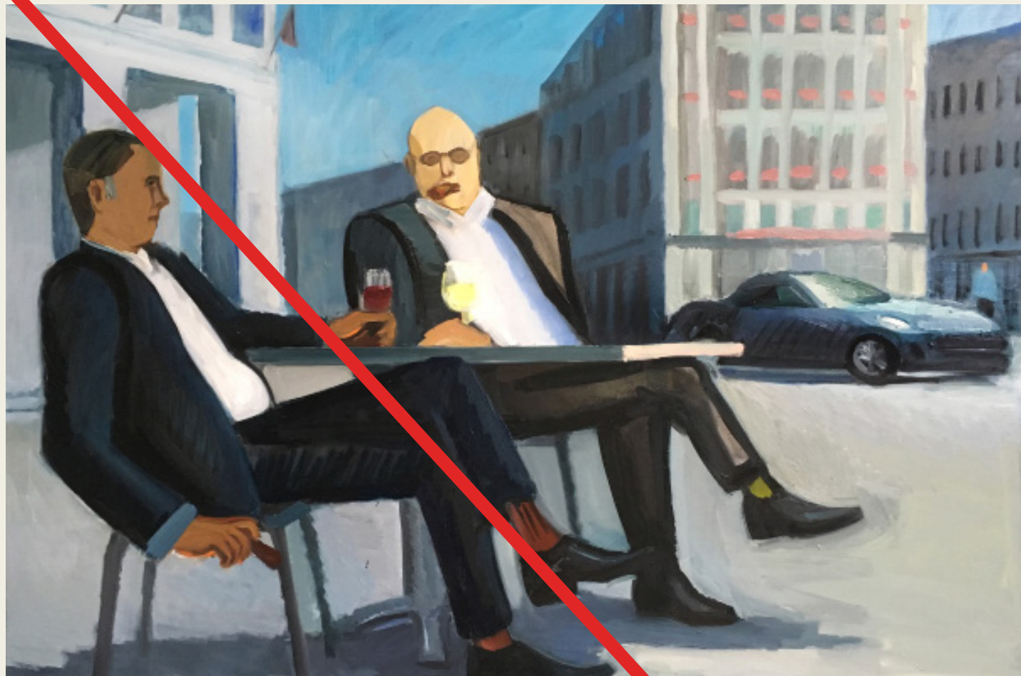
ציור: אנה לוקשביסקי